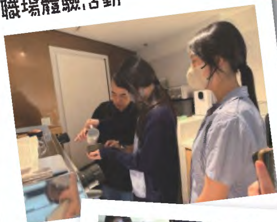
職場體驗活動 - 咖啡拉花