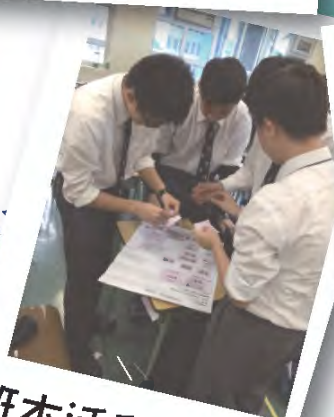
班本活動 - 「砌好」履歷表