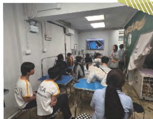
職場體驗活動 - 寵物美容