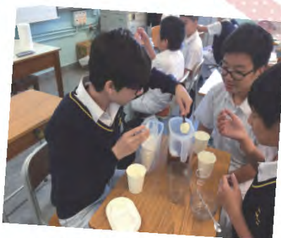
班本活動 職場認識-手調飲品