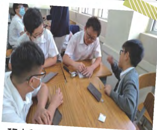
班本興趣體驗 - 皮革製作