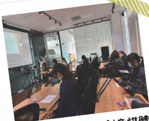
職場體驗活動 - 創意媒體