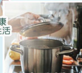
帶動家庭照顧者為自己 及家人烹飪有營美食