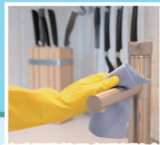
協助服務使用者重新擁有 整齊清潔的家居