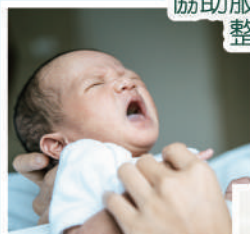
輔導產婦享受健康 有營開心的月子生活