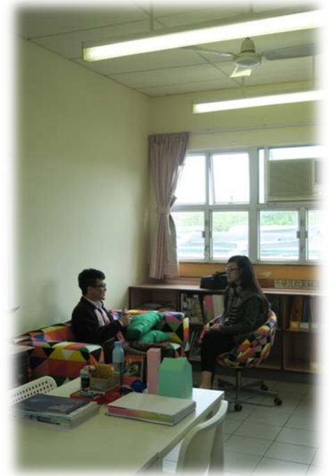
社工正與學生討論升學方向